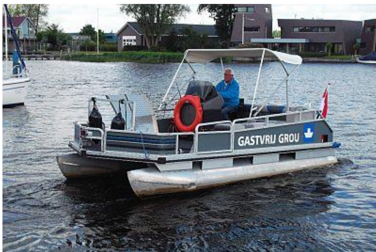
Het huidige pontjein Grou, dat eigenlijk wat te klein is.

Maar volgend jaar zal daar verandering in komen. Dankzij diverse financiële bijdragen is nu 50.000 euro beschikbaar om een nieuwe veerpont te laten bouwen. Dat zal gebeuren bij de Grouwse scheepswerf De Schiffart. Het pontje wordt van hetzelfde type als nu al vaart bij de Sytebuorren (Fr18), gelegen aan de oostkant van het eiland De Burd. Men hoopt dat de nieuwe boot in het voorjaar van 2016, als het nieuwe vaarseizoen begint, in gebruik genomen kan worden.