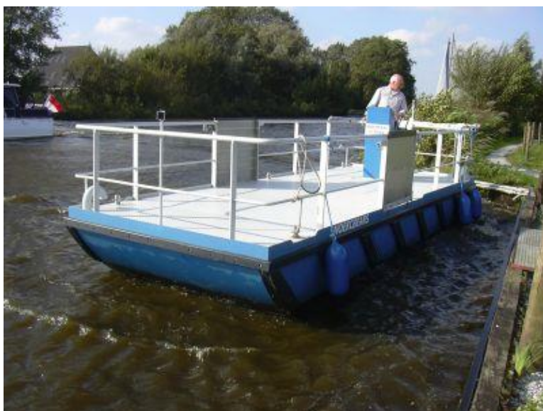
Het pontje van Sytebuorren. Een soortgelijk pontje zal worden gebouwd voor de verbinding naar Grou.